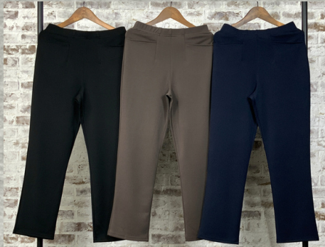
(1)ブラック(2)チャコールグレー(3)インディゴ