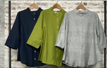
(1)ネイビー(2)ライトグリーン(3)グレー

20 ラフコットンリネンマエアキブラウス 24B06004 綿85%麻15% モデル身長157CM インド製