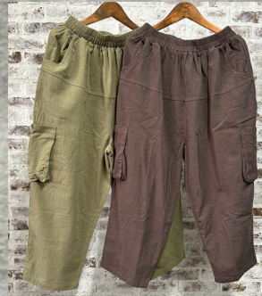
(1)ライトカーキ (2)ブラウン

32 ワッシャー切替ワイドパンツ 24P04014 綿90%麻10% モデル身長157CM 中国製