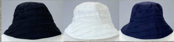
(1)ブラック (2)ナチュラル (3)インディゴ