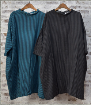
(1)ターコイズ (2)チャコール

49 ダブルガーゼチビエリユッタリワンピース 24D06024 綿100% モデル身長157CM インド製