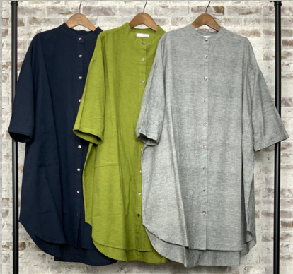
(1)ネイビー(2)ライトグリーン(3)グレー

19 ラフコットンリネンマオカラーユッタリシャツワンピース 24D06002 綿85%麻15% モデル身長157CM インド製