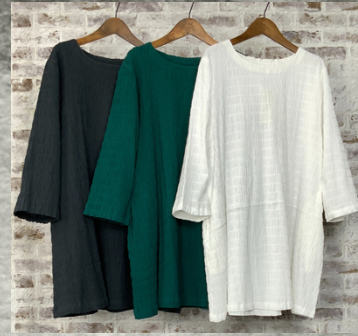
(1)チャコール(2)ブルーグリーン(3)ホワイト