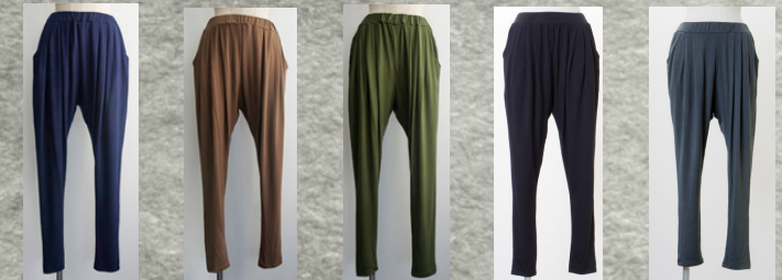
(1)インディゴ(2)ライトブラウン(3)カーキ (4)ブラック (5)グレー

定番 ソフトサルエルパンツ FP002 レーヨン95%ポリウレタン5% モデル身長158CM タイ製