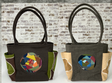
(1)ダークブラウン (2)グレー