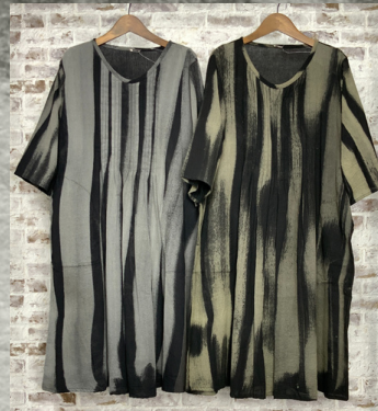
(1)ブラック (2)グリーン

30 手描き柄フロントピンタックワンピース 24D01088 綿100% モデル身長157CM タイ製