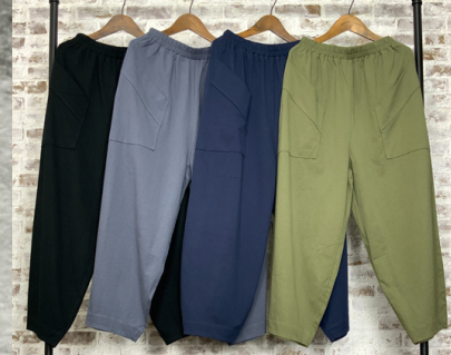
(1)ブラック(2)グレー(3)インディゴ(4)カーキ