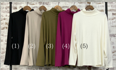
(1)ブラック(2)グレーベージュ(3)カーキ(4)ラズベリー(5)オフホワイト