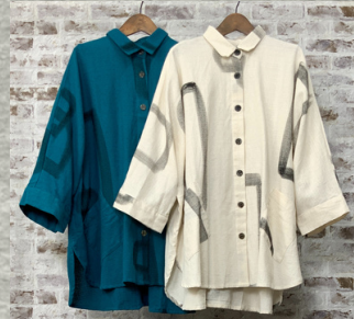
(1)ターコイズ (2)ナチュラル