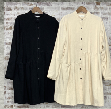
(1)ブラック (2)ナチュラル

22 タイコットンケリカエギャザーワンピース 24D01007 綿100% モデル身長157CM タイ製