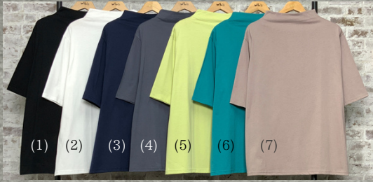
(1)ブラック(2)ホワイト(3)ネイビー(4)グレー(5)イエロー(6)ターコイズ(7)ベージュ

定番 コットンニットボトルネックトップス FB004 綿100% モデル身長151CM 中国製