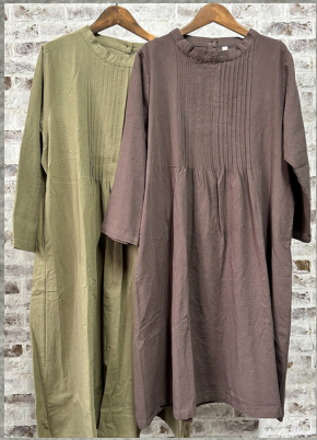
(1)ライトカーキ (2)ブラウン