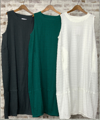
(1)チャコール(2)ブルーグリーン(3)ホワイト