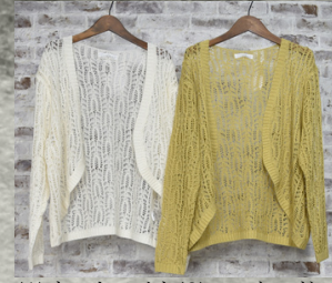
(1)オフホワイト(2)マスタード

42 ネットニットカーディガン 24B04018 ナイロン40%ポリエステル35%麻25% モデル身長157CM 中国製