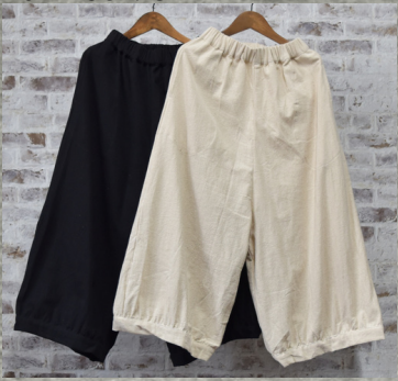
(1)ブラック (2)ナチュラル

21 タイコットンワイドパンツ 24P01005 綿100% モデル身長157CM タイ製