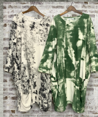
(1)ブラック (2)グリーン

2 ボリューム変形ワンピース 24D05006 綿100% モデル身長157CM タイ製