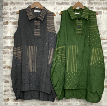
(1)チャコールグレー (2)グリーン