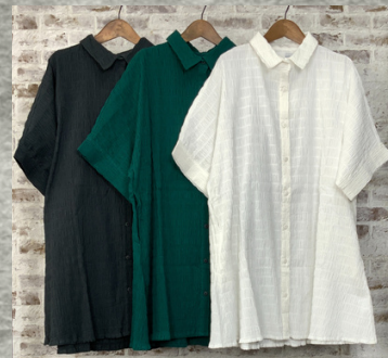
(1)チャコール(2)ブルーグリーン(3)ホワイト