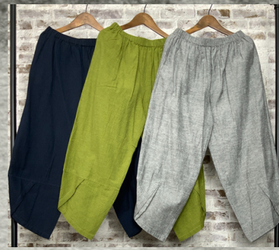
(1)ネイビー(2)ライトグリーン(3)グレー

18 ラフコットンリネンリラックステーパーズ(裏付) 24P06001 表地:綿85%麻15%裏地:綿100% モデル身長157CM インド製