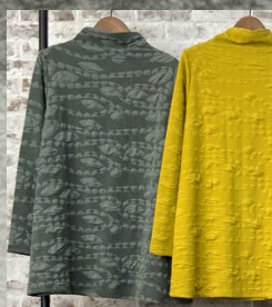
(1)グレー (2)マスタード