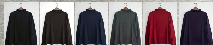
(1)ブラック (2)ブラウン (3)ネイビー (4)グレー (5)ワインレッド (6)ダークパープル