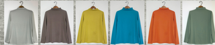
(7)ホワイト (8)ベージュグレー (9)イエロー (10)ターコイズ (11)オレンジ (12)ミント