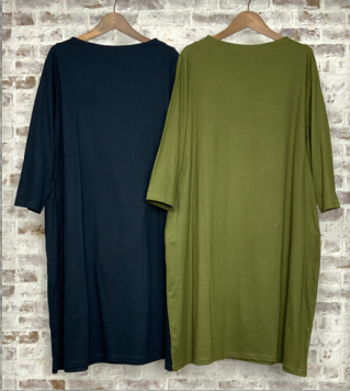
(1)インディゴ (2)カーキ

45 コットンニットボトルネックワンピース 24D01000 綿100% モデル身長157CM タイ製