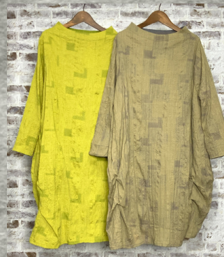
(1)ライトグリーン (2)グレー