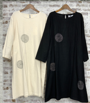
(1)ナチュラル (2)ブラック