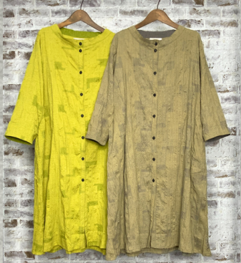
(1)ライトグリーン (2)グレー