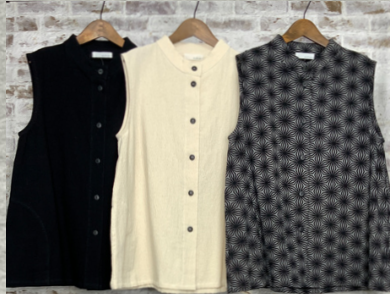
(1)ブラック (2)ナチュラル (3)柄ブラック

23 タイコットンマエアキベスト 24V01008 綿100% モデル身長157CM タイ製