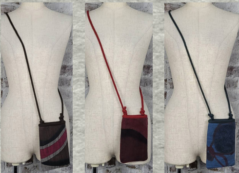
(1)グレー (2)レッド (3)ブルー