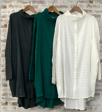
(1)チャコール(2)ブルーグリーン(3)ホワイト