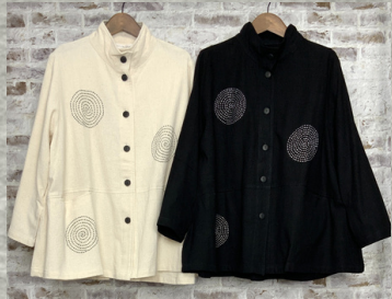
(1)ナチュラル (2)ブラック