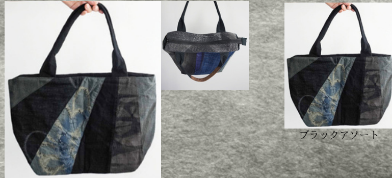
ブラックアソート

※この製品はインドネシアで全て手作業で染めています。 天候や季節により色合いに変化がありますのでご理解ください。