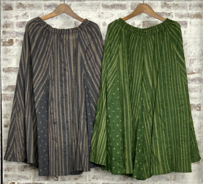
(1)チャコールグレー (2)グリーン