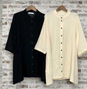
(1)ブラック (2)ナチュラル

24 タイコットンAラインワンピース 24D01009 綿100% モデル身長157CM タイ製