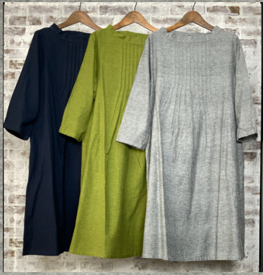
(1)ネイビー(2)ライトグリーン(3)グレー

17 ラフコットンリネンフロントピンタックワンピース 24D06000 綿85%麻15% モデル身長157CM インド製