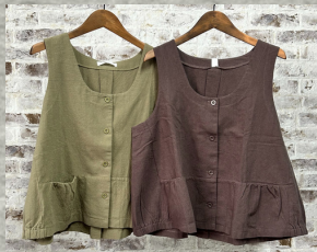
(1)ライトカーキ (2)ブラウン

31 ワッシャー前開きベスト 24V04012 綿90%麻10% モデル身長157CM 中国製