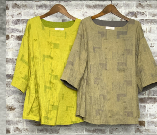
(1)ライトグリーン (2)グレー