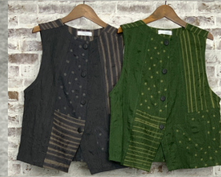
(1)チャコールグレー (2)グリーン