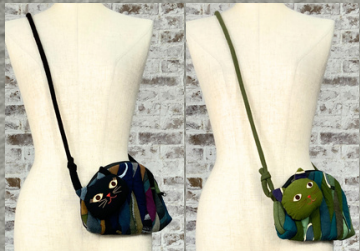
(1)ブラック (2)グリーン