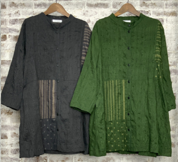
(1)チャコールグレー (2)グリーン